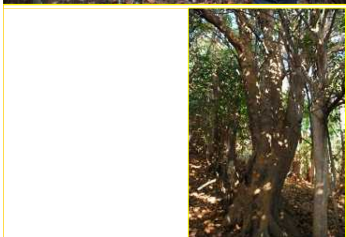
16 赤檜の古木 標高450m 自然林整備候補地