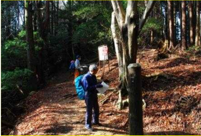
10 国有林44北限 標高625m 境界杭・□九三