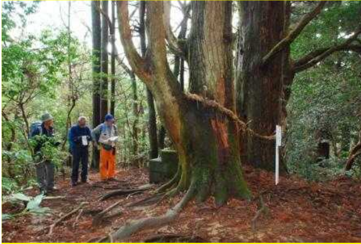
09 天狗杉 標高625m