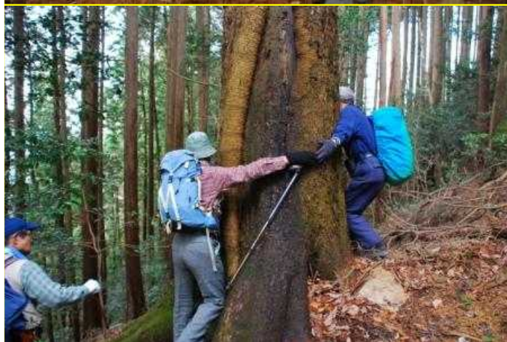
14 皮裂け梅 標高595m