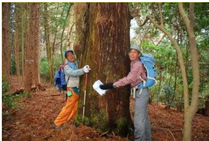
13 親子杉 標高610m