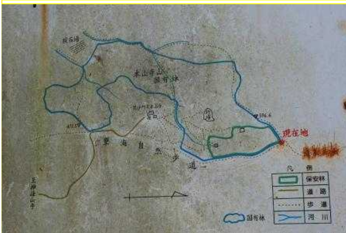
11 国有林44北限と干害防備保安林