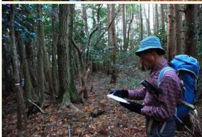
15 尾根上平坦地 標高580m 間伐候補地